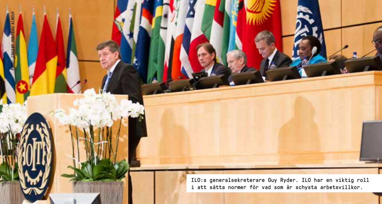
ILO:s generalsekreterare Guy Ryder. ILO har en viktig roll i att sätta normer för vad som är schysta arbetsvillkor.