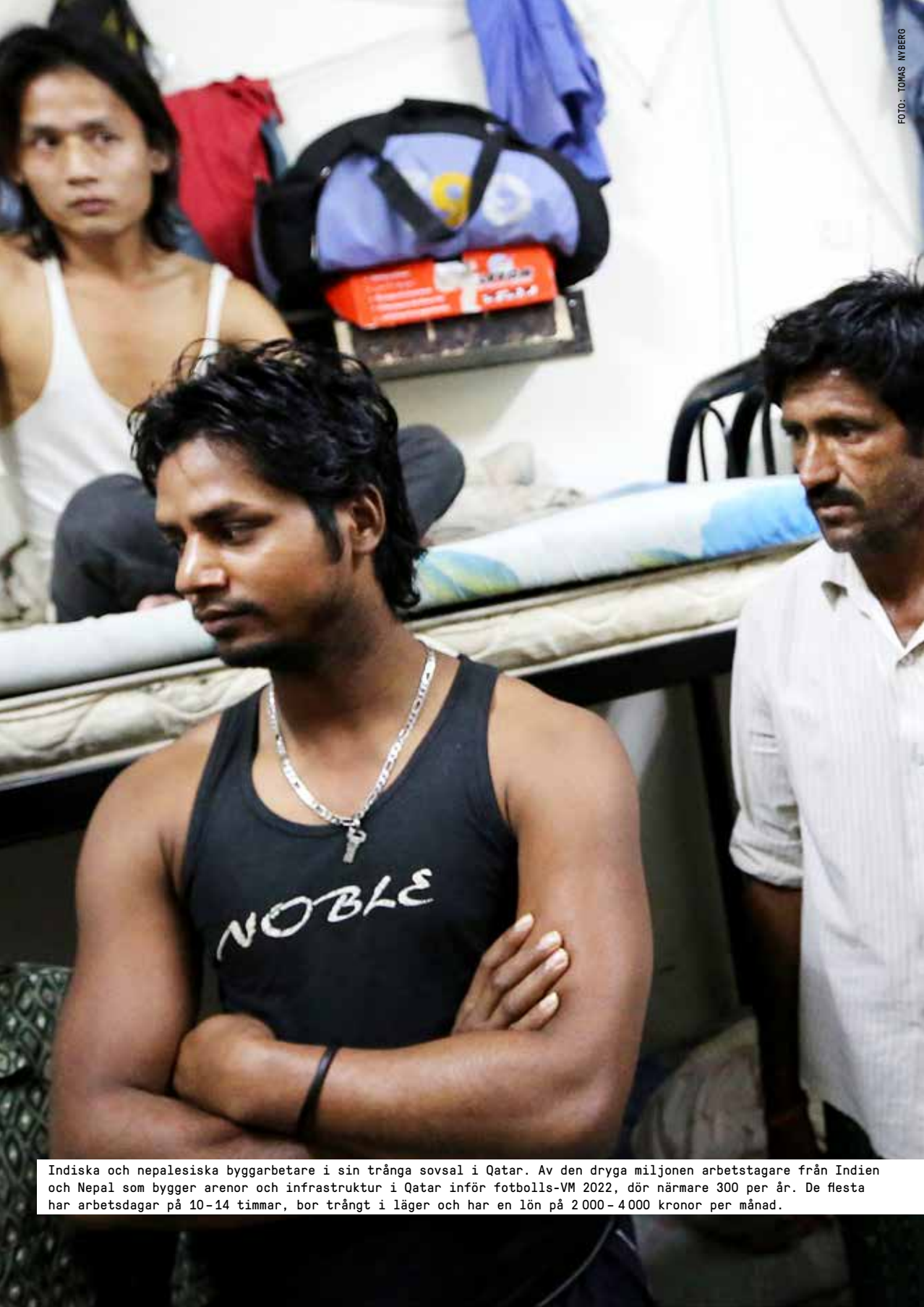
Indiska och nepalesiska byggarbetare i sin trånga sovsal i Qatar. Av den dryga miljonen arbetstagare från Indien och Nepal som bygger arenor och infrastruktur i Qatar inför fotbolls-VM 2022, dör närmare 300 per år. De flesta har arbetsdagar på 10-14 timmar, bor trångt i läger och har en lön på 2 000-4 000 kronor per månad.